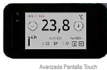
Avanzada Pantalla Touch